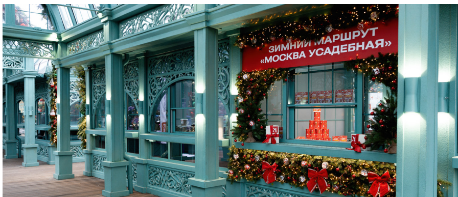
*Флагманская площадка «Усадьбы Москвы» в «Коломенском»