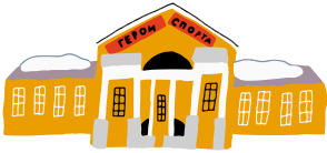
УСАДЬБА А.К. РАЗУМОВСКОГО (Государственный музей спорта)

Время работы объектов рекомендуется уточнять на официальных ресурсах дополнительно.