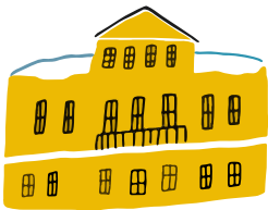
УСАДЬБА ВАСИЛЬЧИКОВЫХ (Музей военной формы)