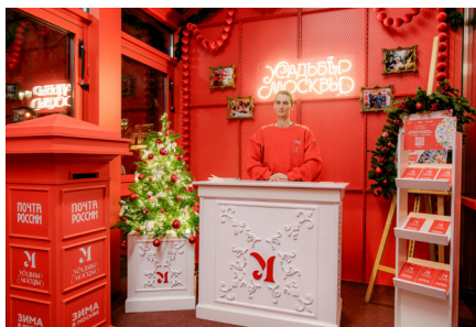
*Инфозона на Тверском бульваре