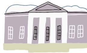
ДОМ-МУЗЕЙ И.С. ТУРГЕНЕВА