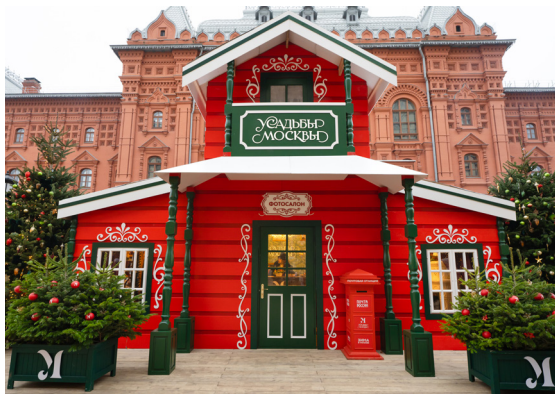
*Фотосалон на Манежной площади