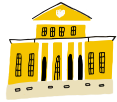
УСАДЬБА ХРУЩЕВЫХ — СЕЛЕЗНЕВЫХ (Государственный музей А.С. Пушкина)