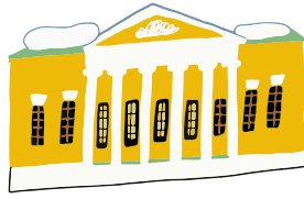
УСАДЬБА ЛОПУХИНЫХ — СТАНИЦКОЙ (Государственный музей Л.Н. Толстого)