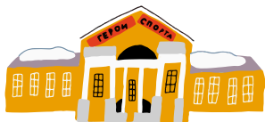
УСАДЬБА А.К. РАЗУМОВСКОГО (Государственный музей спорта)

Время работы объектов рекомендуется уточнять на официальных ресурсах дополнительно.