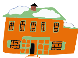
МУЗЕЙ-УСАДЬБА Л.Н. ТОЛСТОГО В ХАМОВНИКАХ

Вт, Пт, Сб, Вс 11:00–18:00 Ср, Чт 11:00–21:00 Пн — ВЫХОДНОЙ