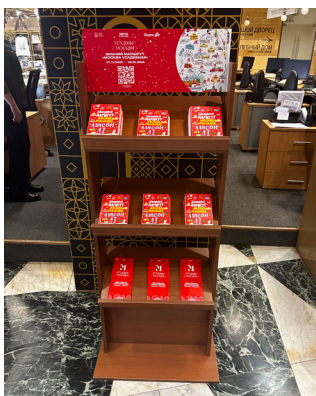
*Инфостойка внутри усадьбы

Карту можно получить в любой локации маршрута: в усадьбах, инфозонах и на флагманской площадке фестиваля «Усадьбы Москвы» в музее-заповеднике «Коломенское». При выдаче карты участнику ставится первый бесплатный штамп .