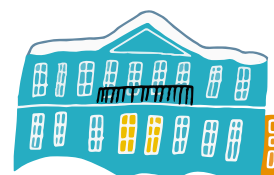
ОСОБНЯК СЕМЬИ ХИТРОВО (Мемориальная квартира А.С. Пушкина)