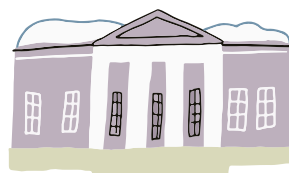
ДОМ-МУЗЕЙ И.С. ТУРГЕНЕВА

Вт, Ср, Пт, Сб, Вс 10:00–20:00 Чт 11:00–21:00 Пн — ВЫХОДНОЙ