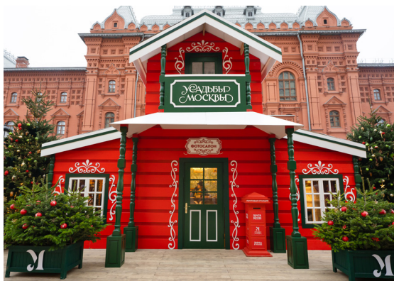
*Фотосалон на Манежной площади