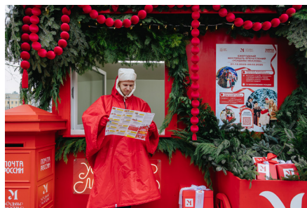
*Инфозона на Болотной площади