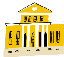
УСАДЬБА ХРУЩЕВЫХ — СЕЛЕЗНЕВЫХ (Государственный музей А.С. Пушкина)

Вс, Ср, Пт 10:00–18:00 Пн, Вт, Чт 12:00–20:00 Сб 11:00–19:00