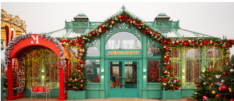
*Флагманская площадка «Усадьбы Москвы» в «Коломенском»