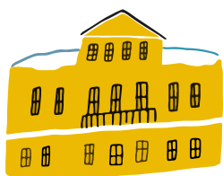
УСАДЬБА ВАСИЛЬЧИКОВЫХ (Музей военной формы)

Пн — ВЫХОДНОЙ Вт, Ср, Пт — Вс 10:00–18:00 (КАССА ДО 17:30) Чт 13:00–21:00 (КАССА ДО 20:30)