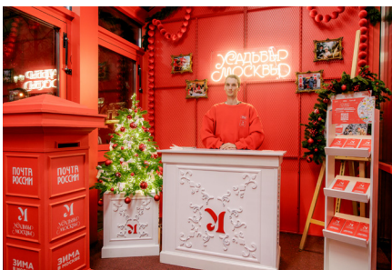
*Инфозона на Тверском бульваре