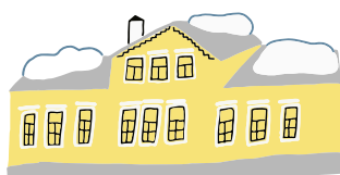
ДОМ-МУЗЕЙ А.И. ГЕРЦЕНА

Вт — Вс 10:00–18:00 КАССА ДО 17:30 Пн — ВЫХОДНОЙ