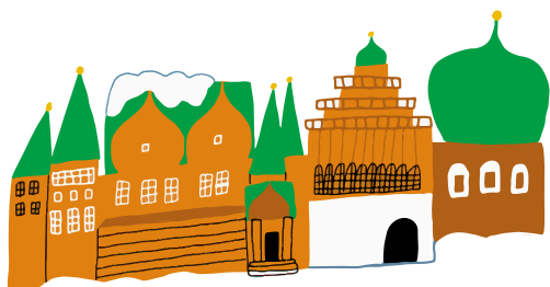
ДВОРЕЦ ЦАРЯ АЛЕКСЕЯ МИХАЙЛОВИЧА В КОЛОМЕНСКОМ