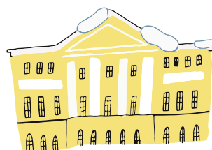
УСАДЬБА ГУБИНА (ММОМА)

Вт, Чт 12:00–20:00 Ср, Пт, Сб, Вс 10:00–18:00 Пн — ВЫХОДНОЙ