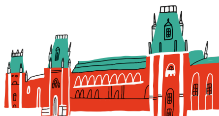
МУЗЕЙ-ЗАПОВЕДНИК «ЦАРИЦЫНО» (Большой дворец и Хлебный дом)