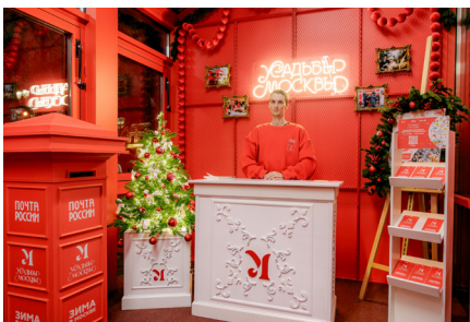
*Инфозона на Тверском бульваре