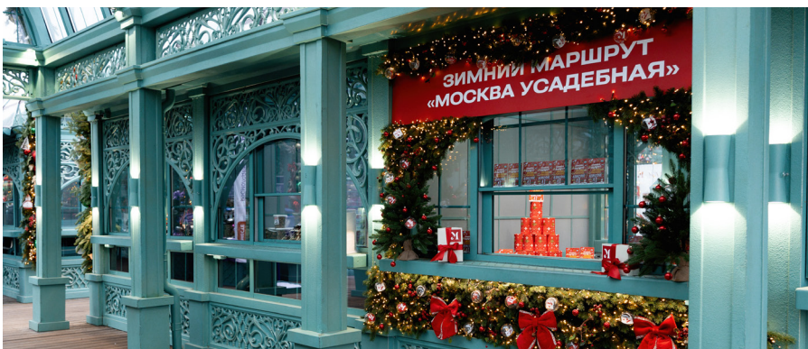
*Флагманская площадка «Усадьбы Москвы» в «Коломенском»