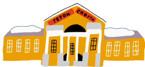
УСАДЬБА А.К. РАЗУМОВСКОГО (Государственный музей спорта)

Время работы объектов рекомендуется уточнять на официальных ресурсах дополнительно.