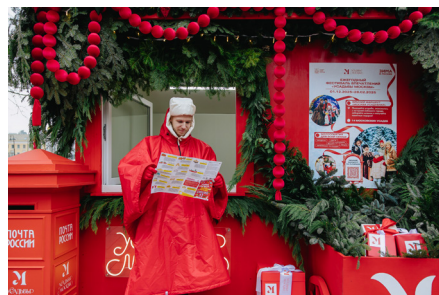
*Инфозона на Болотной площади